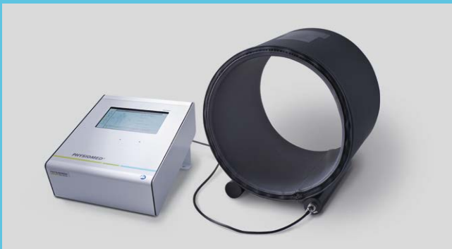
Cilindro, Ø 30 cm, para aplicar la terapia de campos magnéticos en las extremidades y la cabeza

MAG-Expert con cilindro antracita, Ø 60 cm integrado en camilla de tratamiento para aplicar la terapia de campos magnéticos en grandes áreas; en la columna vertebral, la cadera y el cuerpo entero