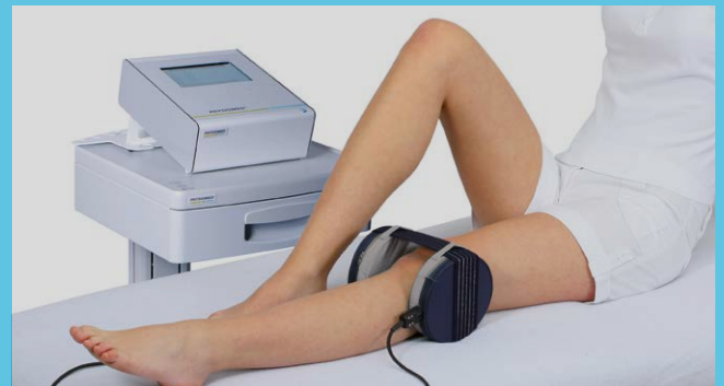
Magnetoterapia con el juego de aplicadores