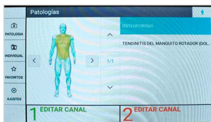
Menú de patologías con práctica función de filtrado por zona corporal

Gracias a la tecnología MFC, los campos magnéticos se concentran casi exclusivamente en la zona interior del cilindro. De este modo, la carga innecesaria del personal de tratamiento se evita.